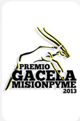
Premio Nacional Gacela MisionPyme 2013 Liderazgo tecnológico