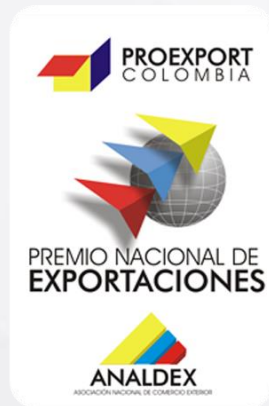
Premio Nacional de Exportaciones 2000 Proexport AnalDEX