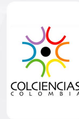
Reconocimiento Colciencias Entidad Innovadora